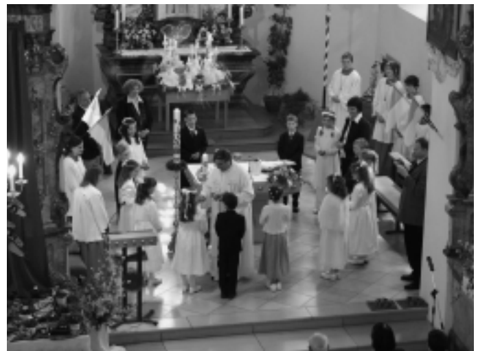
(Weitere Bilder im Verkündblatt sowie an der Korkwand in der Kirche)

Das nächste Verkündblatt erscheint am 26.04.07. Abgabetermin: 24.04.07.