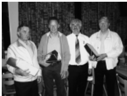
Die neuen Ehrenmitglieder.