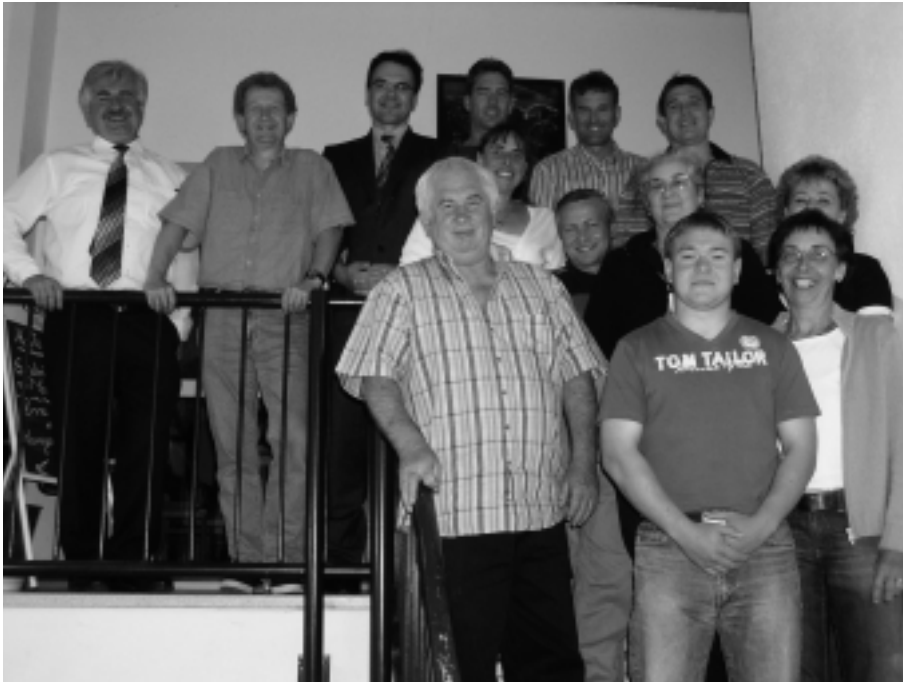
Die alte und die neue Vorstandschaft.