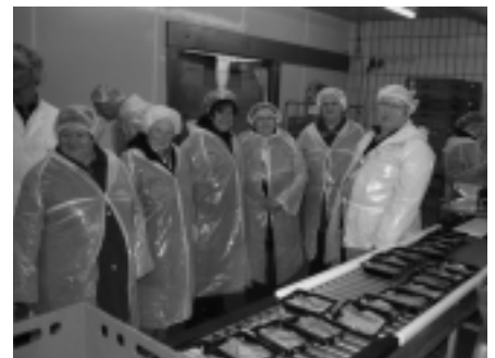
Ein Teil der Teilnehmer bei der Besichtigung

Nach einer zwei Stunden dauernden aufschlussreichen Betriebsführung war man sehr beeindruckt von der qualitativen und erstklassigen Herstellung und Verarbeitung eines regionalen Lebensmittelproduktes.