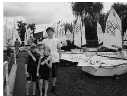
Yacht Club Sipplingen Der Vorstand

Die komplette Terminliste für die Saison 2009 kann in den Schaukästen und auf der Homepage des Yacht Clubs unter www.ycsi.de eingesehen werden.