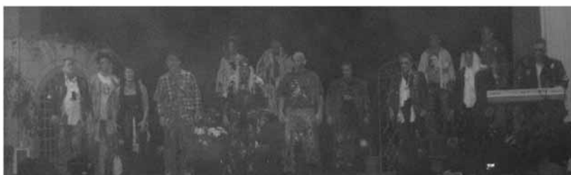
Die Küchen – und Thekenmannschaft