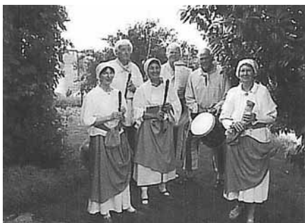
SINGEN UND SPIELEN

DIE „HEGAU-SPIELLEUT“ AUF FLÖTEN, GAMBEN, DULCIANEN GEMSHÖRNERN, SCHALMEIEN UND SCHLAGWERK