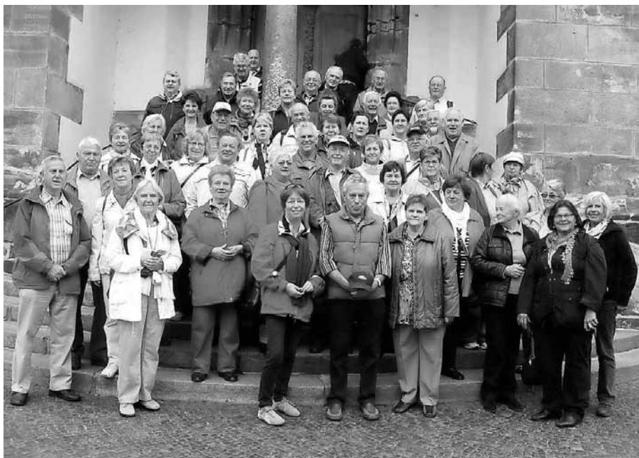
Die Wandergruppe aus Sipplingen und Langenwolmsdorf vor der Sankt Peter und Pauls Kirche in Görlitz.