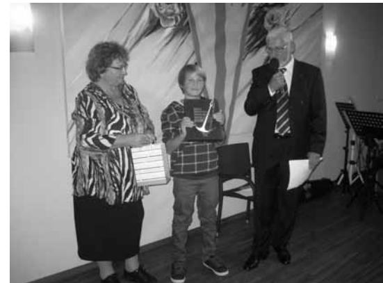
Yacht Club Sipplingen Der Vorstand