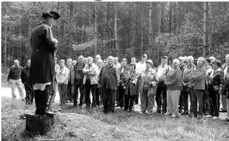
Räuberhauptmann Karasek erzählt seine spannende Geschichte.