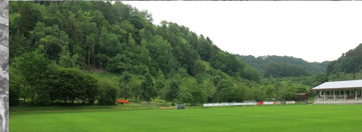
4 – Das bestehende Vereinsheim und die bestehende Obstwiese (gelbgrüne Fläche im Plan, hinter den Werbebannern im Foto) wirken als sichtbar verstellendes Element nach Osten hin. Der im Norden anschließende mit Bäumen bewachsene Berg (links im Bild) verhindert Sichtbeziehungen von Norden her. Die bestehende Hecke im Norden des Sportplatzes (links im Bild) grünt die Maßnahmen zum Sportplatz hin ein.