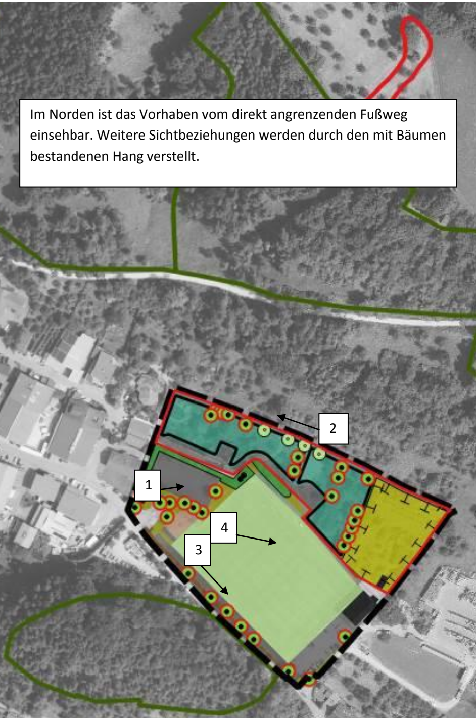
Im Norden ist das Vorhaben vom direkt angrenzenden Fußweg einsehbar. Weitere Sichtbeziehungen werden durch den mit Bäumen bestandenen Hang verstellt.