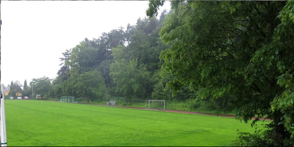
3 – Nach Süden wird der Sportplatz, auf dessen Fläche die geplanten Gebäude eingeschränkt sichtbar sind, durch eine Hecke von der angrenzenden Straße getrennt. Südlich an die Straße grenzt der bewaldete Homberg (Bildhintergrund) an, der nach Süden sichtbar wirkt.