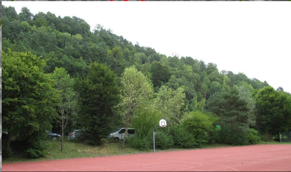
1 – Die Maßnahmenfläche wird im Westen des Plangebietes durch eine teils lückige Baumhecke zu den angrenzenden Sportplätzen hin eingegrünt.