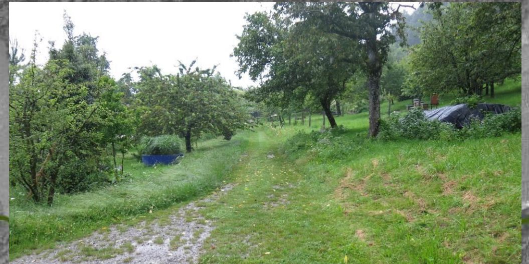
2 – An der nördlichen Grenze des Plangebietes verläuft ein Fußweg. Die geplanten Gebäude sind von dem ca. 1,5 m breiten Grasweg gut einsehbar, die angrenzenden hängigen Streuobstflächen sind von Bäumen bestanden und daher in ihrer Einsehbarkeit eingeschränkt.