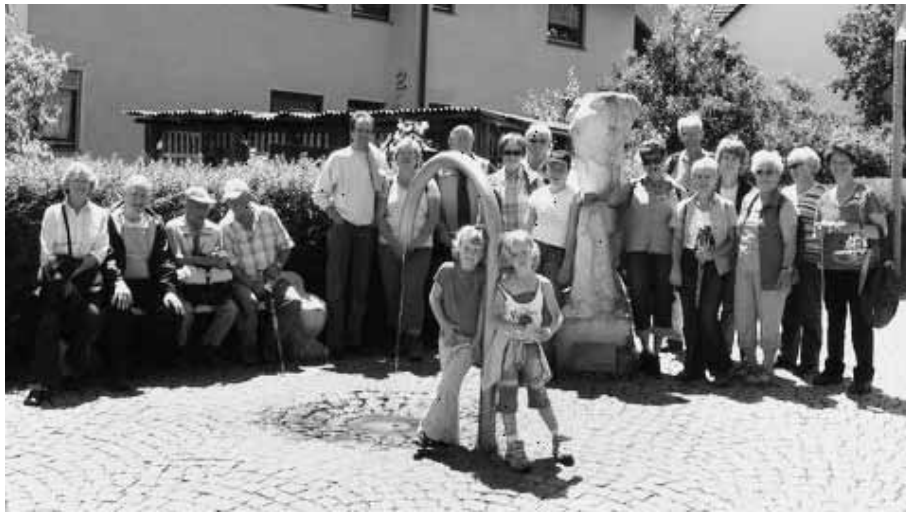
Die Wandergruppe vor dem Brunnen der Ottilienquelle in Randegg