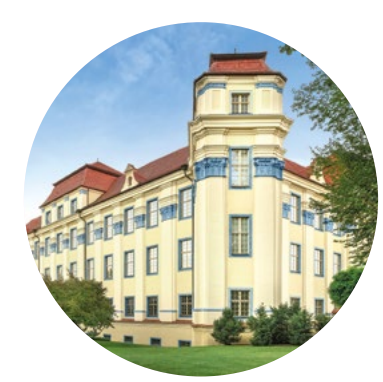
Neues Schloss Tettang