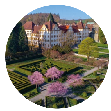
Kloster und Schloss Salem