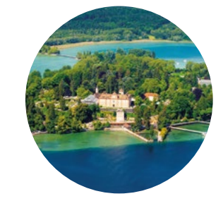
Insel Mainau: Hunde sind willkommen, müssen aber an der Leine geführt werden. Lediglich im Schmetterlingshaus und im Schloss Mainau erhalten Hunde keinen Zutritt.