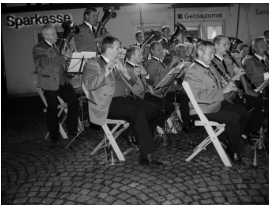
Abendkonzert der Musikkapelle Sipplingen auf dem historischen Rathausplatz

Nach dem Seitenwechsel machte unsere Mannschaft immer mehr Druck, die sich bietenden Tor-Gelegenheiten konnten nicht genutzt werden. Ein Gegenzug führte aus einer unbedrängten Spielsituation zu einem fragwürdigen Handelfmeter. Der Gegner ließ sich diese Chance nicht nehmen und nutzte diese zur erneuten Führung. Unsere Mannschaft ließ sich wenig beeindrucken, und blieb weiter spielbe-