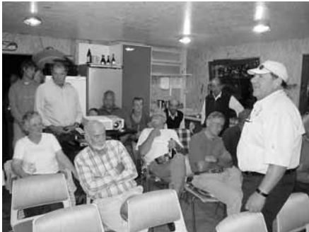
Yacht Club Sipplingen Der Vorstand